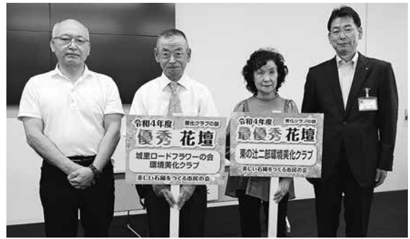
▲令和4年度表彰団体の皆さま