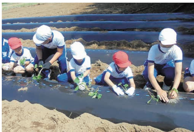
▲1・6年によるサツマイモ苗植え