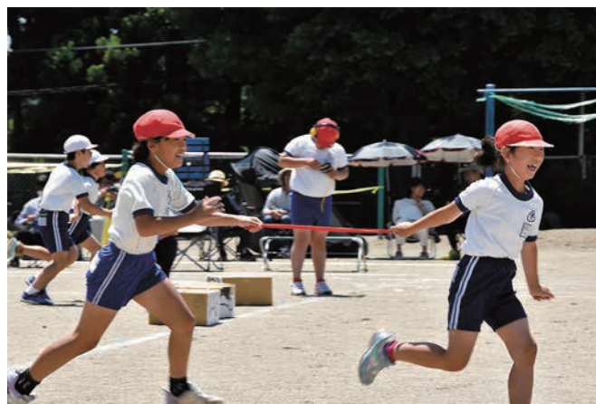
▲2・4年による運動会種目