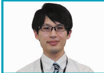
八郷プロバンス 担当：細谷 TEL 44-3221