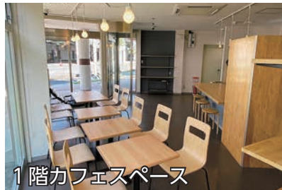
1階カフェスペース