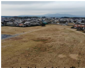
いしおかイベント広場 (約27,500㎡)

建設候補地は、市が保有する土地の中から新施設の建設に適していると思われ、かつ、本市のまちづくりについて定める各種計画との整合性が図ることができる土地を選定することとします。