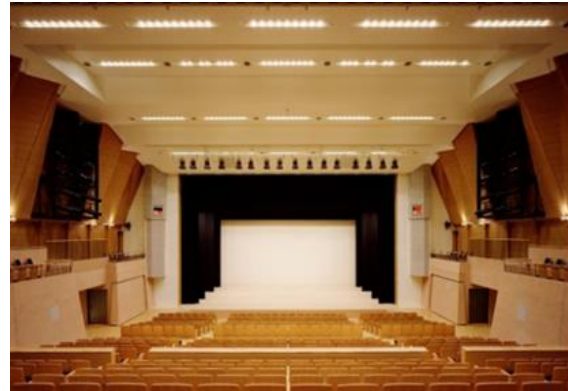
シューボックス形式