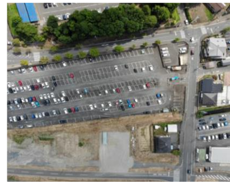
市営駅東駐車場 (約6,900㎡)