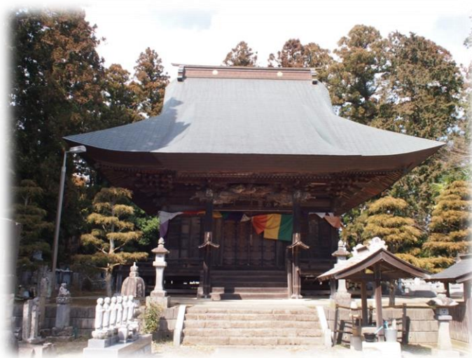
↑盛賢寺 明治9年に学校が置かれた ←井関郷小学校・集積・越石金取立帳 小学校設置に向けた活動の記録