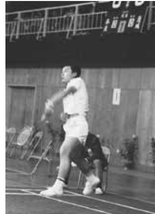
▲バドミントン競技高校男子準決勝 茨城県VS奈良県