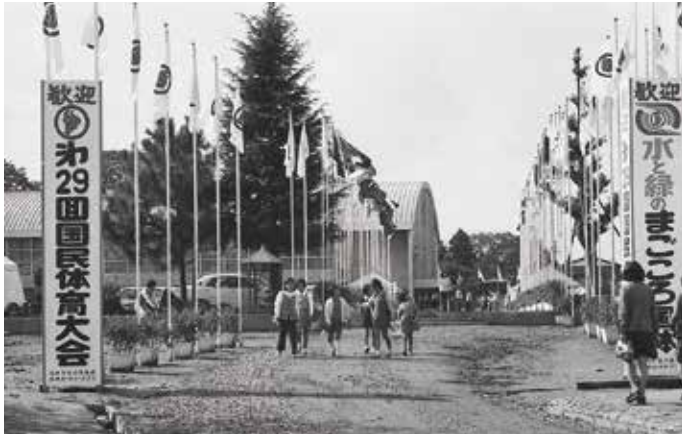
▲バドミントン競技の会場の1つとなった 石岡小学校の体育館

今回の企画展では国体の開催が当時の人達のスポーツ普及や充実にどのような貢献をしたのかを紹介します。今年度開催されるゆめ国体の予備知識として知っていただき、国体や社会体育活動を考えるきっかけになれば幸いです。