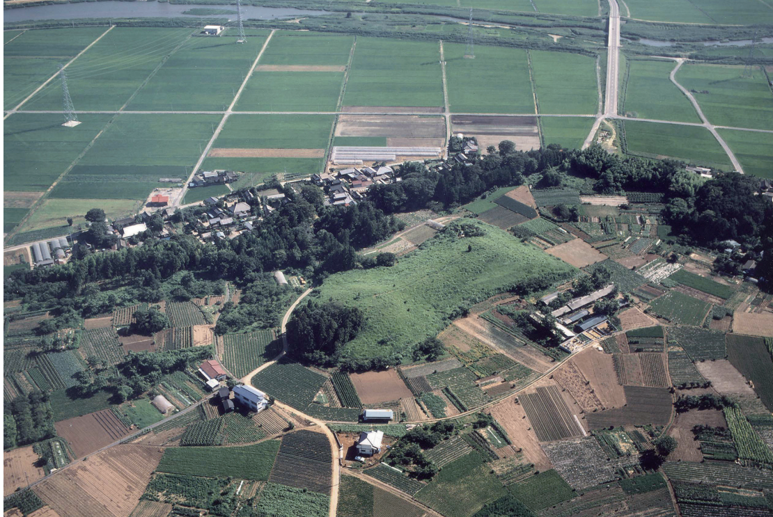
◀舟塚山古墳 (北東から。奥に恋瀬川が流れる)

舟塚山古墳は、東日本第2位の規模を誇る前方後円墳です。その規模から古くから注目され、大正10年には全国で初めて指定を受けた38件のひとつとして、国の史跡に指定されました。