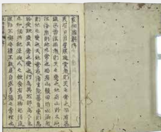
↑『家相図解 上・下』寛政元年 ↓『流行 第5年3月号』明治41年