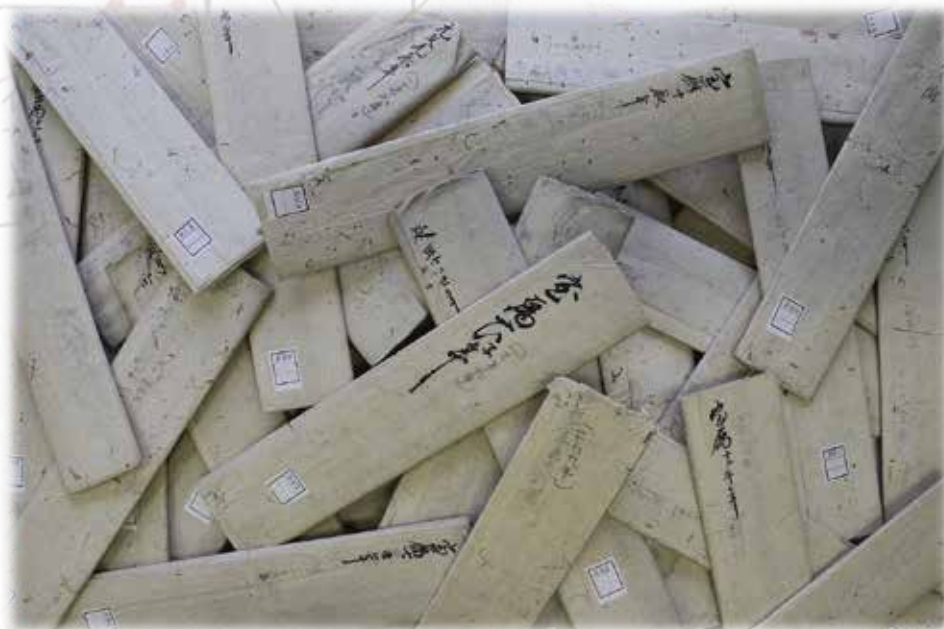
井関村御年貢可納取付之事（年貢割付状）

これらを紐解くと、田畑の増減や年貢率の上下、災害や天候不順による影響など、社会や地域の状況を追いかけることができます。そこで今回の展示では土地に関して作られた各種の記録に着目して、近世から近代の石岡に迫っていきこうと思います。