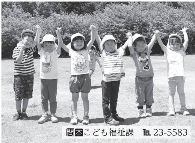
問 本 とも福祉課 TEL 23-5583

受付期間：11月1日(図)～12月6日(図) 午前8時30分～午後5時15分(図は午後7時まで)※土日・祝日は除きます。 ※認定こども園および小規模保育事業所の受付期間は、各施設によって異なります。