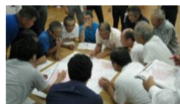
将来の目標地図例