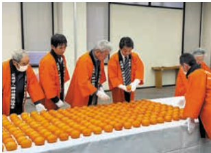
◀献上柿審査会の様子