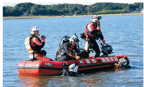
▲潜水探索に臨む救助隊員