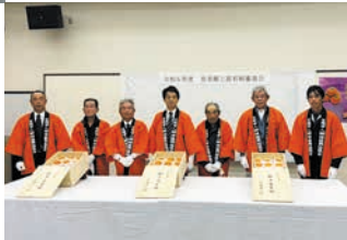
令和5年度皇室献上柿審査員の皆さん▶