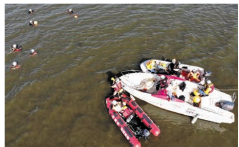
▲上空から撮影した訓練の様子