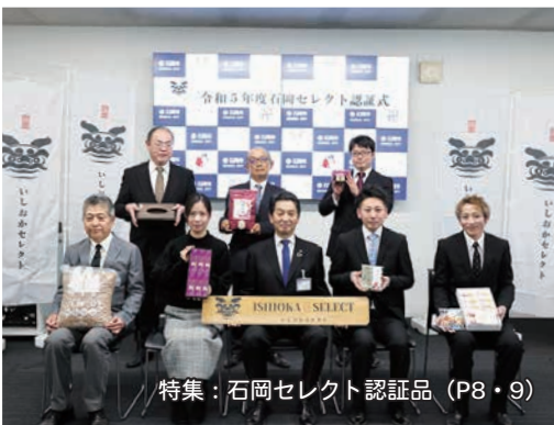
特集：石岡セレクト認証品 (P8・9)