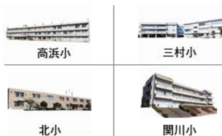
▲ 令和6年3月をもって閉校する小学校4校

令和6年4月1日より、南小学校・高浜小学校・三村小学校・関川小学校の4校を統合し、南小学校として、府中小学校・北小学校の2校を統合し、府中小学校として再編いたします。これに伴い、閉校となる4校（高浜小学校・三村小学校・関川小学校・北小学校）において、閉校式を実施する運びとなりました。