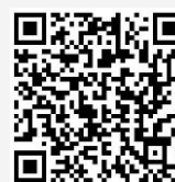
▲石岡セレクト認証品の詳細はコチラ