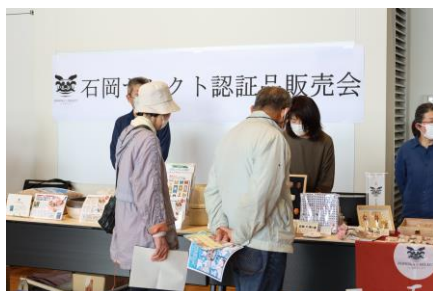
▲ 昨年度の販売会の様子 (R5.3.24)