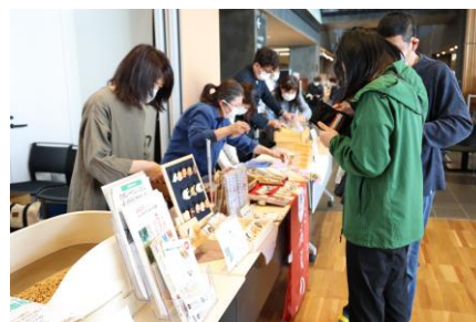
▲ 昨年度の販売会の様子 (R5.3.24)

石岡市は、3月22日（金）石岡市役所本庁舎1階メロディアスホールにて「石岡セレクト認証品販売会」を開催します。