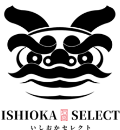
▲ 石岡セレクトオリジナルロゴ