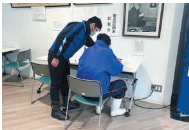
▲罹災証明書申請受付業務支援