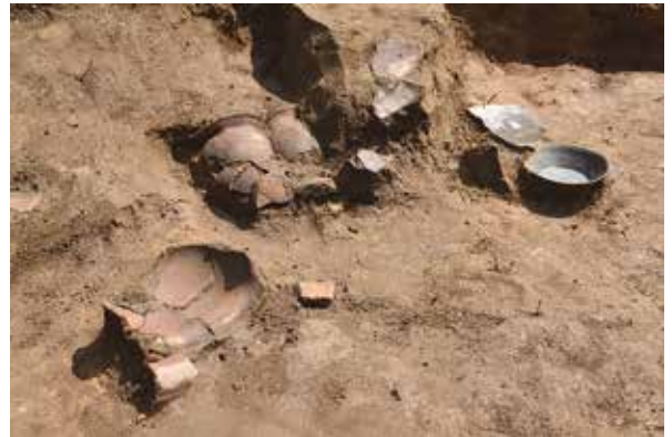
弥陀ノ台遺跡 平安時代竪穴建物跡 遺物出土状況

今回は、近年発掘調査報告書等が刊行された遺跡について、出土品と写真パネルによって紹介します。