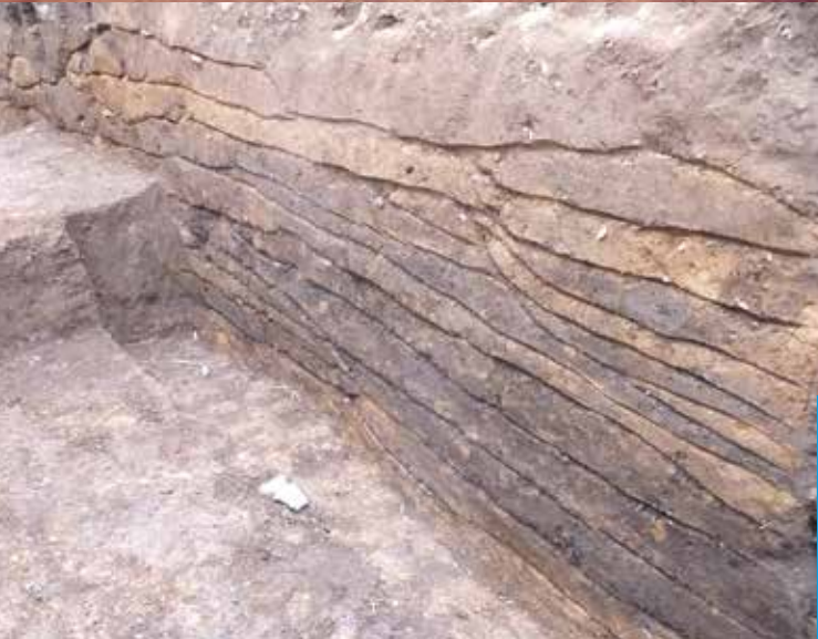
常陸国分寺跡 ガラミドウ地区