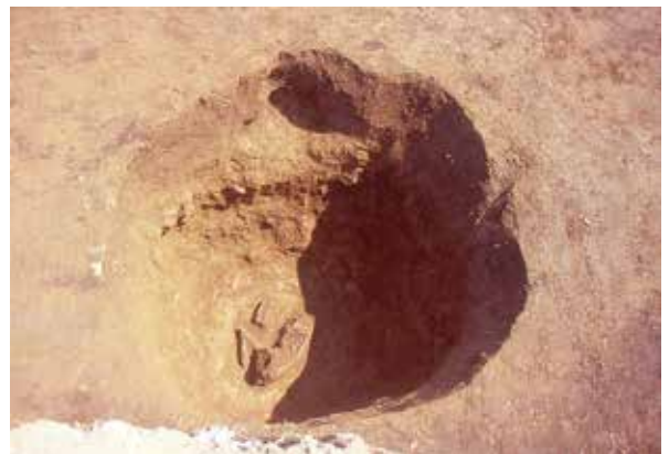
前原塚 江戸時代墓