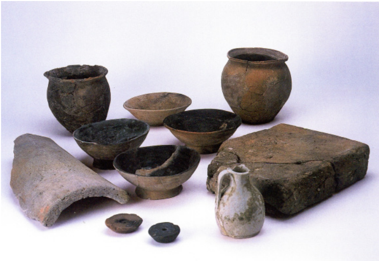
17号住居跡出土遺物（平安時代）