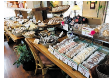
▲店内には手作りのお菓子がたくさん陳列されています。