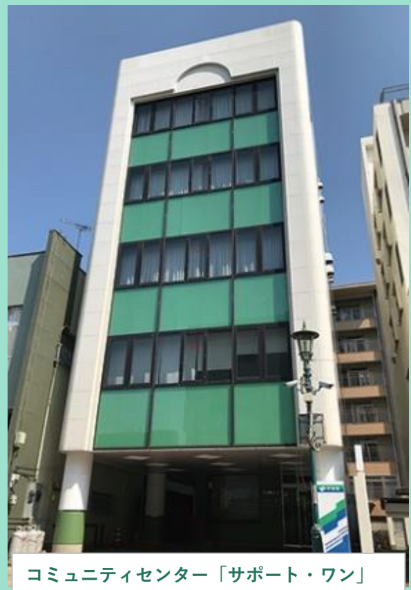
コミュニティセンター「サポート・ワン」

【主な仕事の内容】 ◆小規模・中小企業の経営支援（金融、税務、販路開拓、事業承継、生産性向上、セミナー開催など） ◆中心市街地活性化事業の推進、イベントの企画運営、各種会議の運営、会員サービス事業の企画運営、日商簿記等の検定試験施行、各種共済・保険の加入推進、各種団体運営、経理業務、広報、調査ほか ◆その他、当所が定める業務