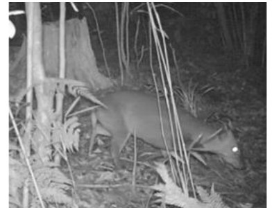
石岡市で確認されたキョン