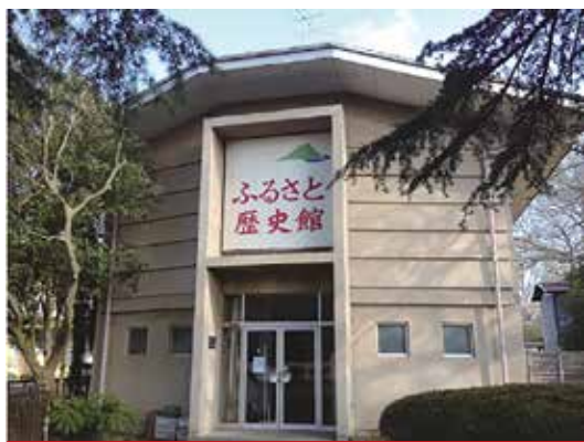
石岡市立ふるさと歴史館

開館時間 午前10時～午後4時30分 休館日 毎週月曜日(祝日の場合は翌日) 交通 JR常磐線石岡駅西口より徒歩約12分 駐車場あり 住所 石岡市総社1-2-10 石岡小学校敷地内 電話 0299-23-2398