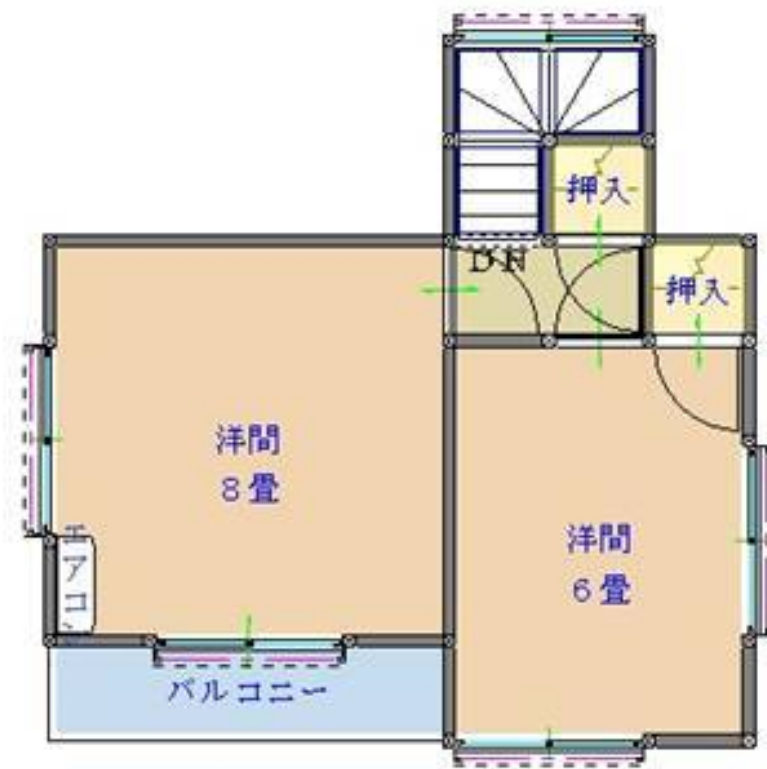
【2F : 58.98㎡】