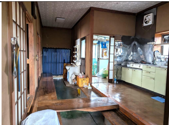
土間から風呂場方面