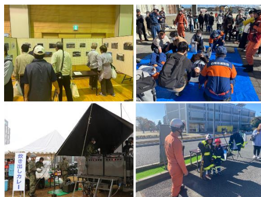
▲ 過年度の防災訓練

市制施行20周年の記念事業として実施する今回は、防災関係機関の連携強化に加え、SDGs や防災に取り組む市内事業所にもご参加いただきます。「見て・体験できる」多彩なブースを中心に構成しており、参加者が楽しみながら災害への備えや行動を学べる内容となっています。地域の防災力を高める絶好の機会です。多くの市民の皆さまのご来場を心よりお待ちしております。