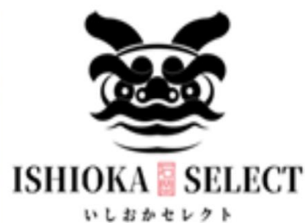
▲石岡市産有機野菜（左）と石岡セレクト認証ロゴ（右）

石岡市は、肥沃な大地と温暖な気候に恵まれた農業の盛んな地域で、有機農業を推進するため環境保全型農業に取り組んでいるほか、令和7年3月に「オーガニックビレッジ宣言」を行い、地産地消と食育のまちづくりを推進しています。今回の「石岡オーガニックフェア」では、石岡セレクトにも認証されている旬な有機野菜を市職員がPR販売します（有機野菜を生産しているJAやさと有機栽培部会は、日本農業賞で大賞【R5.3】・農林水産祭で内閣総理大臣賞【R5.11】を受賞）