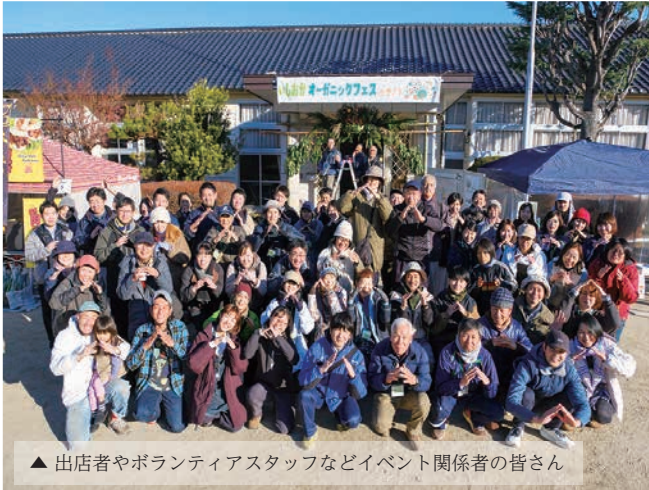
▲ 出店者やボランティアスタッフなどイベント関係者の皆さん