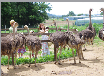
ダチョウ王国石岡ファーム 場所：石岡市半の木 14052

ダチョウに餌をあげる体験ができた、様々な小動物たちと触れ合えたりするところがたまに好きです。