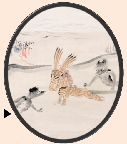
小川芋銭筆『カッパと草馬』部分 ▶