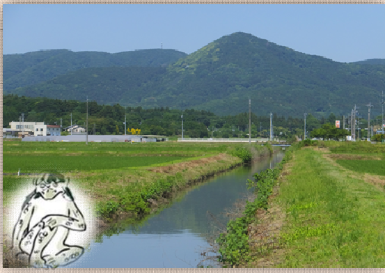
『小倉川の河童とカピタリ餅』の舞台 柿岡館集落を流れる小倉川