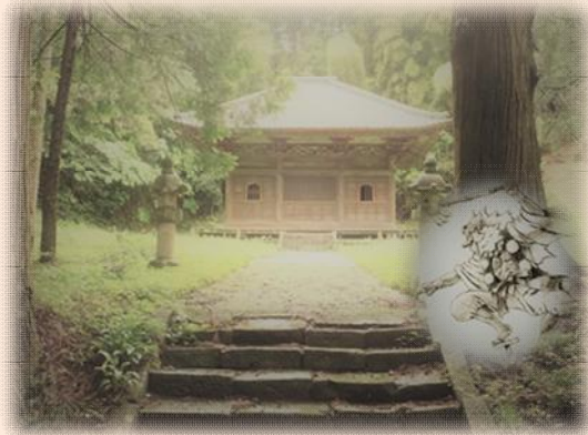
『長楽寺の天狗』の舞台 長楽寺参道