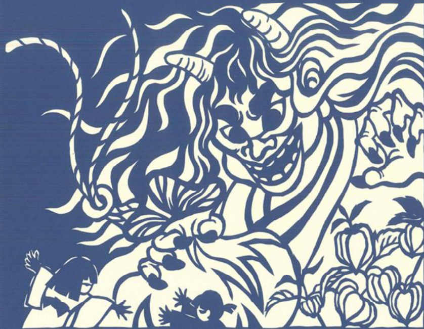
茨城童子がやってきて食べられてしまうよ… 紙芝居絵『龍神山の鬼-茨城童子-』より