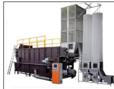
抹茶生産のための加工施設（てん茶炉）