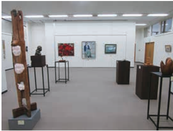
▲第9回石岡アート協会展(第1期)