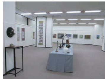
▲第9回石岡アート協会展(第2期)