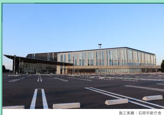
施工実績：石岡市新庁舎

公共・民間工事と2本立ての受注となり、設計・許認可全てを自社で行い、施工に関してもすべて国家資格をもつ技術者が対応しています。また、電気管理法人として太陽光発電所の管理・運営を行っています。