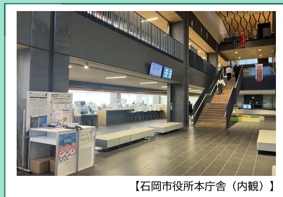
【石岡市役所本庁舎（内観）】