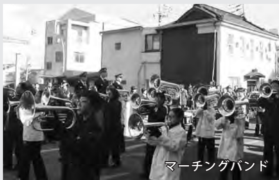
マーチングバンド

出初式には消防本部95人、消防団員430人、婦人防火クラブ25人、幼年防火クラブ60人が参加しました。式典後には御幸通りでマーチングバンドや幼年防火クラブ、ボーイスカウト、婦人防火クラブのパレード、消防団分列行進、車両パレードを実施。最後にハシゴ車による救助訓練を行いました。会場は多くの来場者で賑わいました。