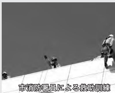
市消防署員による救助訓練