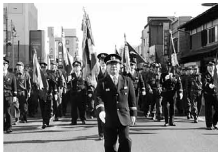
▲地域を守る消防団（1月6日消防出初式）

再編の理由 ▼近年、働き方やライフスタイルが多様化していることから、消防団員の置かれている環境は大きく変化しています。また、進展する少子高齢化や人口減少に対しても、対応可能な体制づくりを進めていく必要があります。このため、再編に向け様々な検討を重ねた結果、効率的な体制は保ちつつ、消防力の充実強化を目指し、八郷地区消防団を再編することになりました。