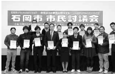
▲報告会での市民討議会参加者の皆さん

昨年8月、石岡青年会議所と市の共催で開催した、市民討議会の検討結果の報告会が行われました。今回のテーマは「switch〜キミはこのまちに恋をする〜」で、公募で集まった市内の若者が、LINEスタンプなど、身近なものをまちづくりに生かせるか検討しました。話し合われた内容は報告書にまとめられ、ホームページから確認できます。