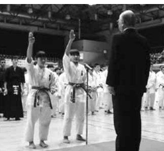
▲4部門、380人が参加しました