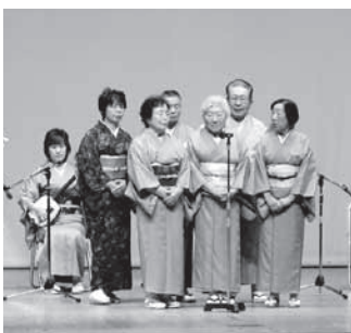
▲ 70 を越える演目を披露

石岡市「芸能祭」が開催 11月26日、中央公民館で第 21回石岡市「芸能祭」が開催 されました。 詩吟・民謡・舞踏の愛好者 の皆さんにより様々な演目が 上演され、訪れた人を楽しま せました。