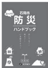
▲昨年発行の防災ハンドブックもご一読ください！

また、一人ひとり置かれている状況や環境は違いますので、この機会に、家族や地域で、集合場所、連絡方法、役割分担など、それぞれの「マイ防災」を考えてみてください。