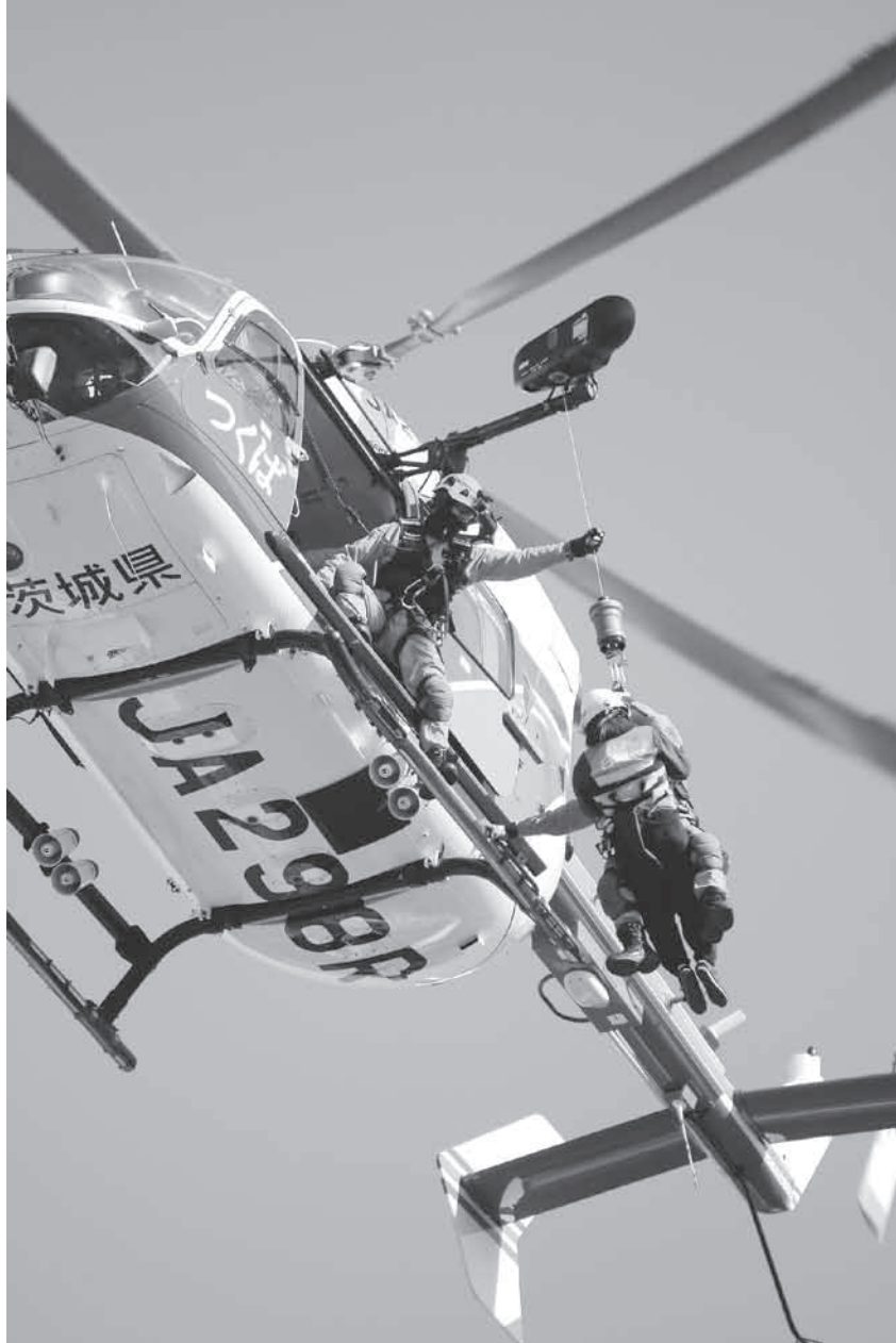
▲県の防災ヘリによる吊り上げ救助訓練の様子（12月10日 北小学校）

「茨城県沖を震源とする大地震が発生。地震の規模はマグニチュード8.0程度、石岡市では震度6強を記録」と想定し、2地区で訓練が実施されました。