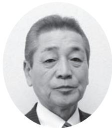
教育委員会教育長 櫻井 信 (再任)