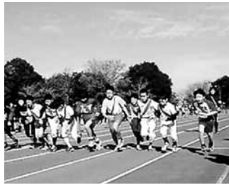
▲かすみがうら市スポーツ少年団と共同で開催しました