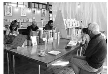
▲本を片手に、ゆっくりと過ごせます

昨年12月23日、朝日里小学校の一室にてサードプレイス「ウリボー」のプレオープンを行いました。地域の方々を中心に60人近くのお客様がいらっしゃいました。