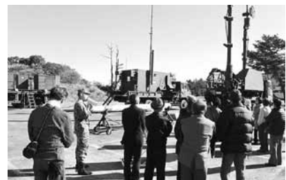
▲当市出身・宮田氏から説明を受ける参加者

石岡市自衛隊家族会は、自衛隊茨城地方協力本部土浦地域事務所の協力を得て、航空自衛隊浜松基地で研修視察しました。当日は20名が参加し、当市出身隊員4名を激励するとともに、自衛隊の装備品や生活の説明を受けました。自衛隊の生の声を聴く、貴重な機会となりました。家族会では引き続き、優秀な人材確保のため、自衛官募集活動に協力していきます。