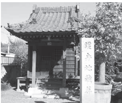
▲護身地蔵尊が奉られているお堂