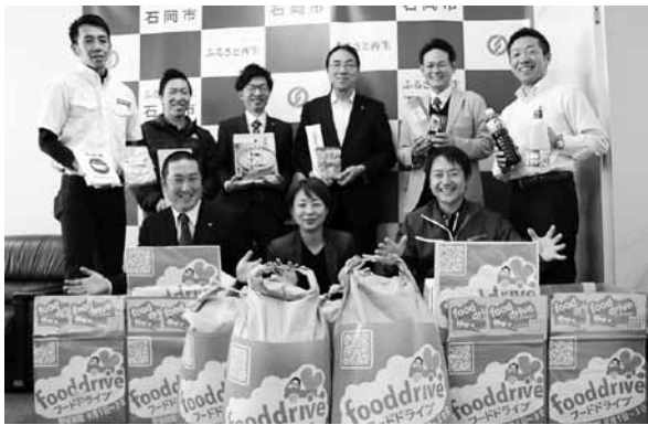
▲沢山の人の温かい気持ちが集まったことに感謝と話すJCMメンバー

フードドライブ事業は、家庭で余った食料品を、まちの協力店舗に持ち寄り、困っている家庭に配るというものです。 石岡青年会議所は、昨年9月から1か月間、約50の店舗に協力を呼びかけ、この事業を実施。会議所メンバーが店舗を回り、食品を回収しました。米、缶詰、めん類など250以上の食品を、市に寄附していただき、現在、社会福祉協議会を通して、申し出により食料を必要としている世帯に配布しています。 石岡青年会議所の活動に対し、12月19日、感謝状を贈呈しました。