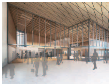
新庁舎の入り口には、展示や交流などを 目的とした多目的ホールがあります

平 成 31 年 1 月からの使用開始に向けて、現在、石岡市役所新庁舎の建設工事が進行中です。構造は地上 3 階、地下 1 階建ての鉄筋コンクリート造。3 月末時点で、2 階の床部分まで組み上がりました。