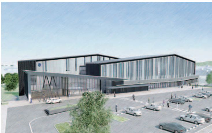
庁舎イメージ図（外観）