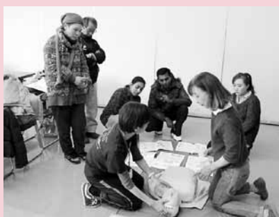
▲無事全員が修了証を受け取りました