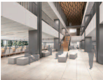
暮らしに必要な一連の手続きを行える 1階フロア