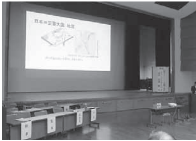
▲115人の区長が参加した講演会