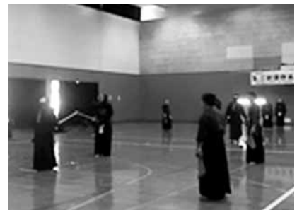
▲練習の成果を発揮する選手たち