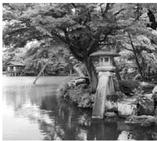
▲日本三名園「兼六園」

⑤ ガラスボトル ハーバリウム作り教室 ▼ドライフラワーやプリザーブドフラワーと専用のオイルを入れて作る、観賞用のインテリアフラワーです。 ① 3月24日(日) 午前10時～11時30分