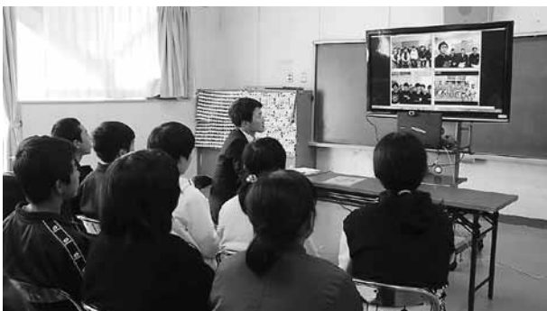
▲テレビ画面に写しだされた他校の児童らと意見交換する杉並小の児童たち

県では 10 年程前から「教育情報ネットワーク」が整備され、小中学校間がインターネットでつながり、テレビ会議が行えるようになってきました。市内の小中学校では、このシステムを使い、他校の同級生と意見交換を行っています。