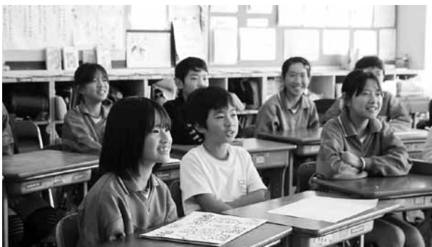
▲高浜小でおこなわれたテレビ会議の様子