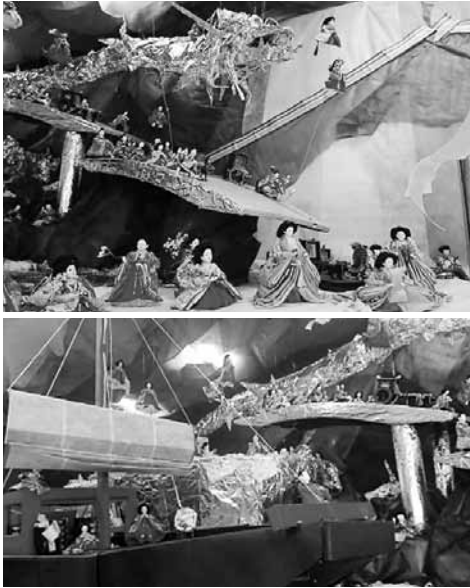
▲昨年の歴史絵巻は「竹取物語第2章門出～紀貫之の心を旅する～」と題して子どもを亡くした老夫婦の心情に迫りました。毎年趣向を凝らしてきた、歴史絵巻シリーズも今年で10年を迎えます。