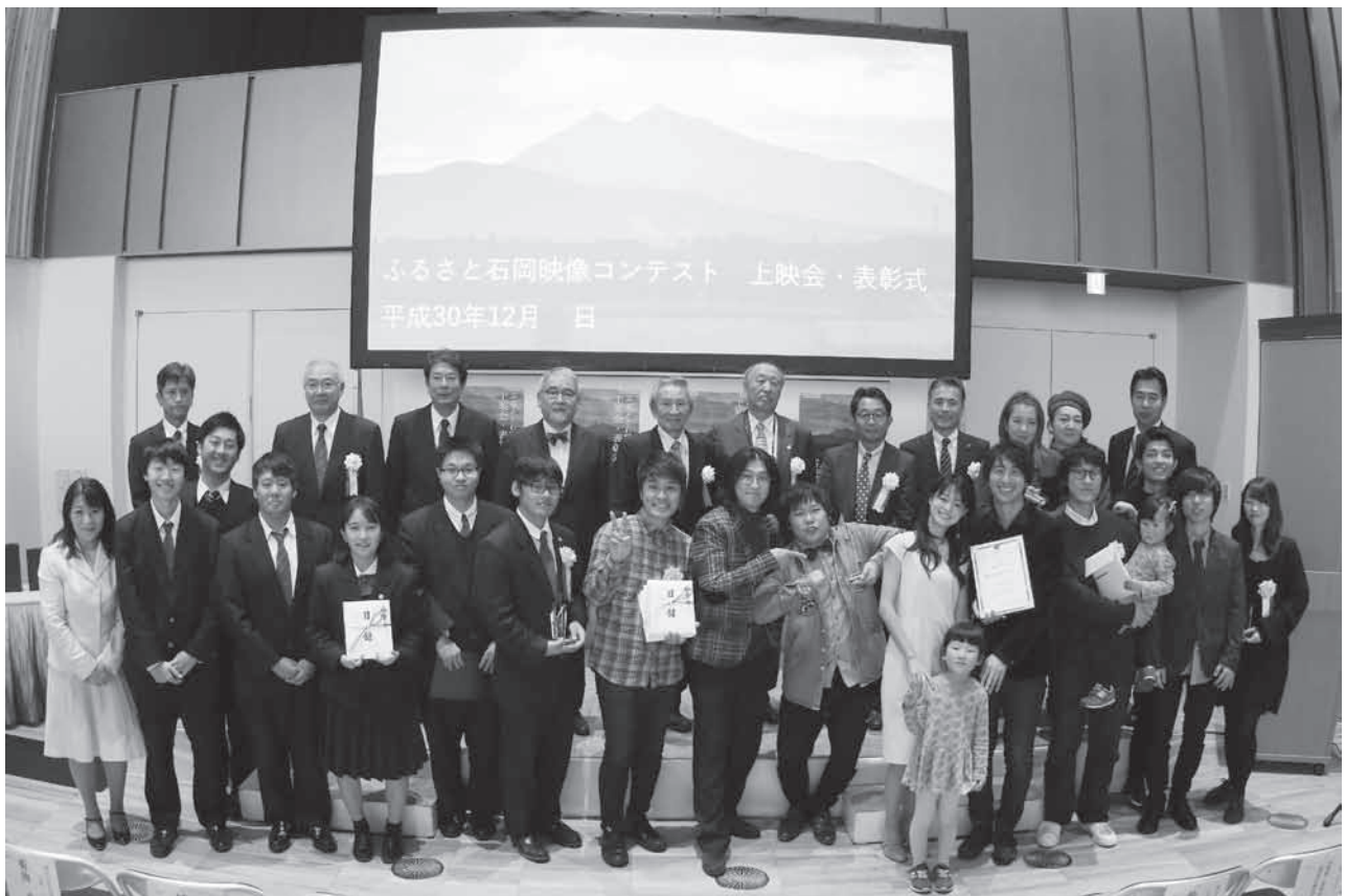
▲受賞した4組と実行委員、審査委員の皆さん