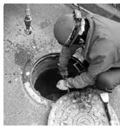
▲詰まりの除去作業の様子。異物が流れ込むとマンホールから汚水があふれ出す可能性もあります

▼最近、水に溶けないティッシュペーパーや油の固まり等による下水道管の詰まりが多発しています。詰まりによりトイレや浴槽などの水が流れなくなり、悪臭も発生してしまうこととなります。快適に生活できるように、適切な利用をお願いします。