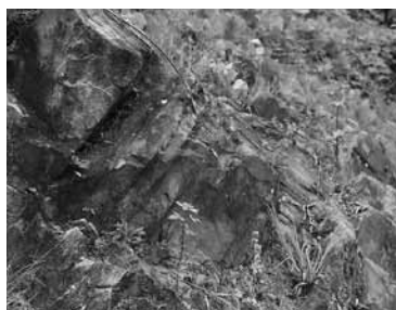
▲龍神山には貴重なジュラ紀の地層が表出している場所があります。