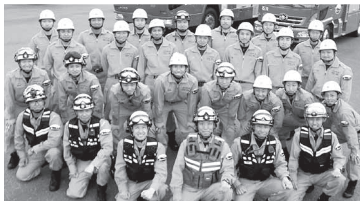
消防本部の救助隊は県消防救助技術大会の引揚救助部門で2年連続・県1位の成績を収めました。救助技術向上のために日々訓練に励んでいます。