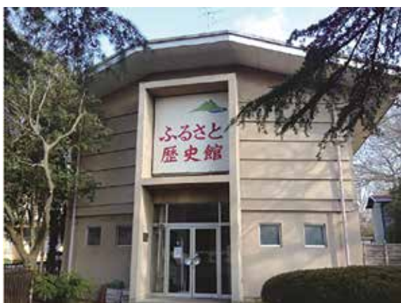
石岡市立ふるさと歴史館

巢山古墳：井上義光 2004「巢山古墳の調査成果」『日本考古学』18 舟塚山古墳：佐々木憲一編 2018『霞ヶ浦の前方後円墳』明治大学文学部考古学研究室