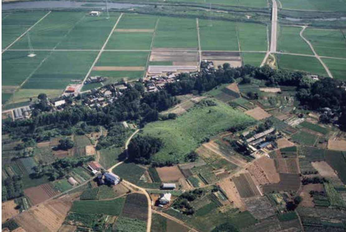
◀ 舟塚山古墳 (北東から。奥に恋瀬川が流れる)

舟塚山古墳は、東日本第2位の規模を誇る前方後円墳です。その規模から古くから注目され、大正10年には全国で初めて指定を受けた38件のひとつとして、国の史跡に指定されました。