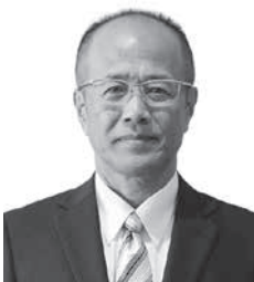
教育委員会教育長 児島 裕治氏