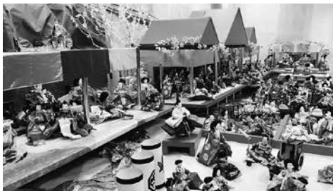
▲昨年の情景飾りの様子