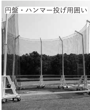
円盤・ハンマー投げ用囲い