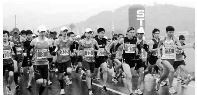
▲昨年度も県内外から多くのランナーが参加