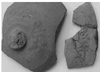
▲「尼寺」(左)と、「茨寺」(右)の墨書土器

市 内には、常陸国分寺跡、茨城廢寺跡など、古代寺院跡が存在しています。しかし国分寺を除いては、すでに廢寺になっているところ。ではなぜそこが寺院跡だと、さらにその名称までわかったのでしょうか。発掘調査をすると、建物の基礎となる礎石や瓦の出土から、寺院跡と推定できることがあります。しかし、それだ