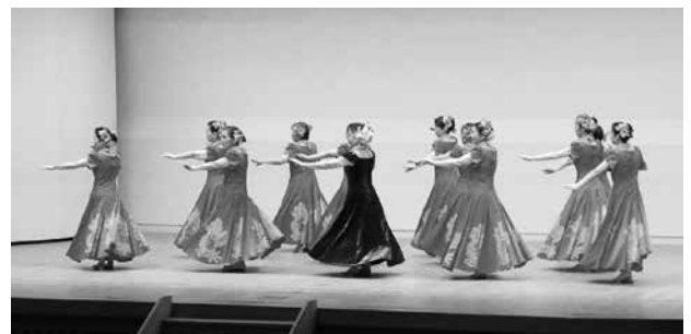
▲昨年度のステージ発表の様子（中央公民館）