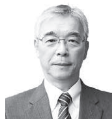
瑞宝双光章 大坪力氏 (元1等陸尉)