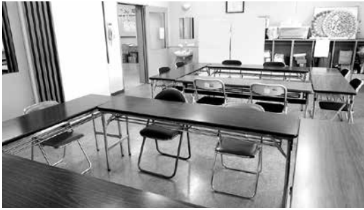
▲石岡市ボランティアセンター

▼社会福祉協議会には、ボランティア活動のための、打ち合わせや練習などに利用できる会議室があります。ぜひボランティア活動に役立ててください。 利用可能日時／月曜日から土曜日（祝祭日は除く） 午前9時～午後5時 申込方法／市社会福祉協議会に電話で申し込み。予約は利用日の3か月前から可能。見学もできます。 問 市社会福祉協議会 TEL 22・2411