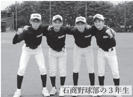
石商野球部の3年生