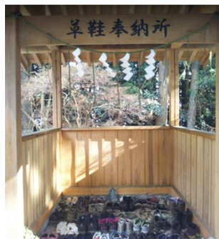
足尾神社 足尾山頂奉納所

足尾山は「足」の神が鎮座する山という信仰があり、足の保全・鍛錬等を祈願する信者がスニーカー等を奉納している。