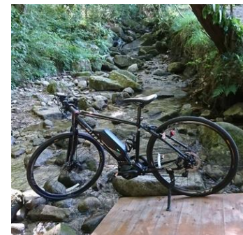
源流② 加波山神社付近