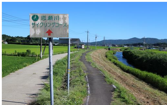
上流（八郷総合支所）付近