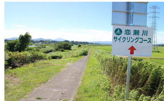
意見が多かった場所付近