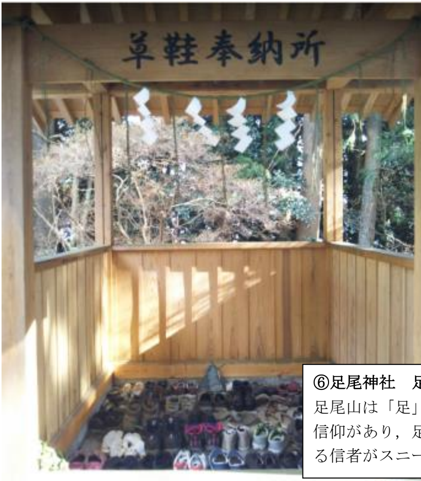
⑥足尾神社 足尾山頂奉納所 足尾山は「足」の神が鎮座する山という信仰があり、足の保全・鍛錬等を祈願する信者がスニーカー等を奉納している。